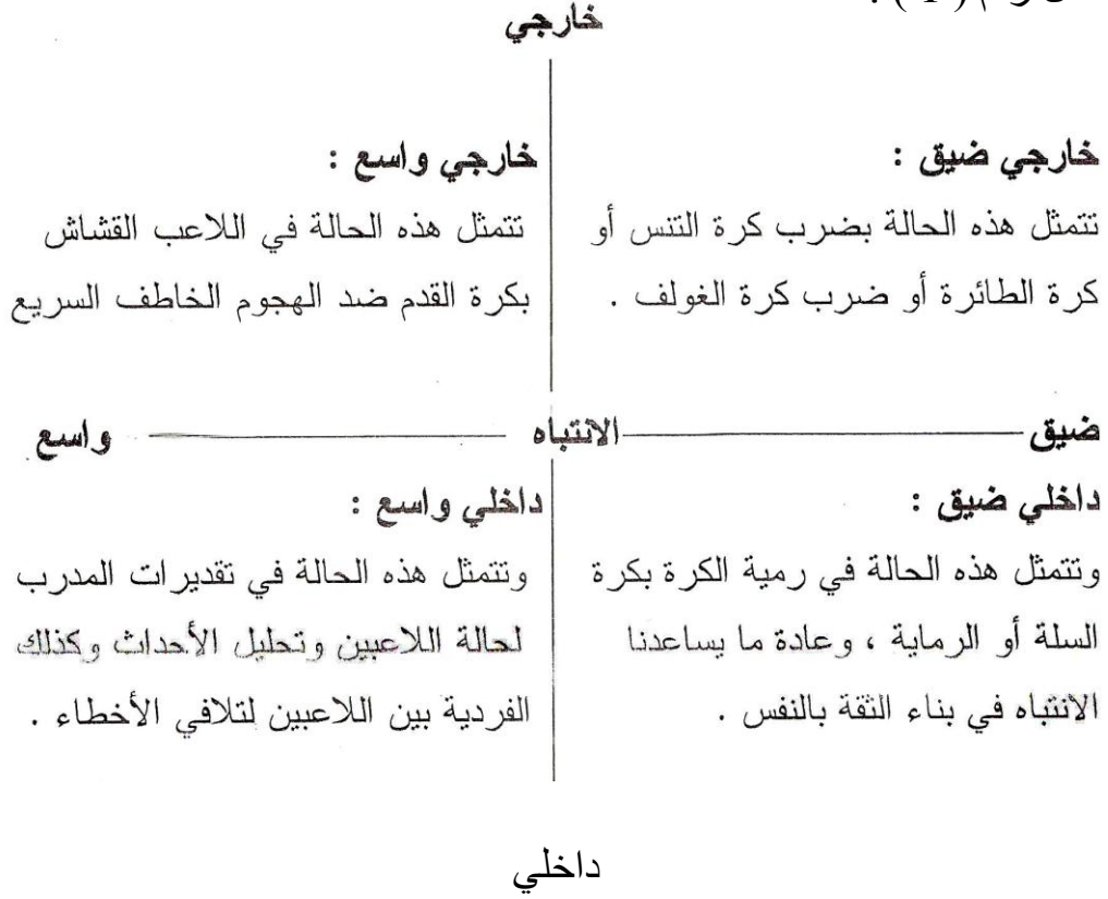
شكل ( 1 ) يوضح مخطط اتجاهات الانتباه