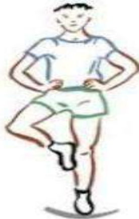
الشكل (1) يوضح اختبار التوازن