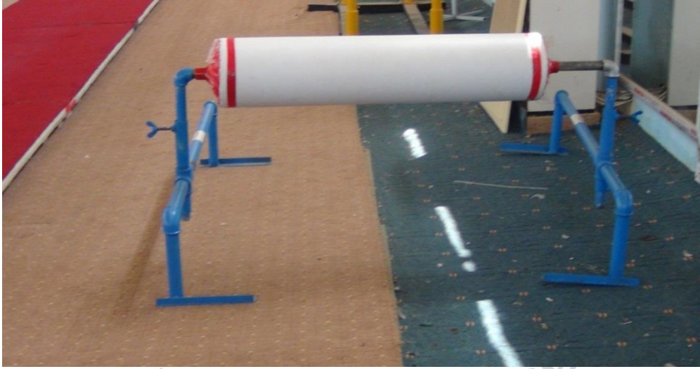
شكل (3) يوضح الجهاز (ساند الاكتاف )